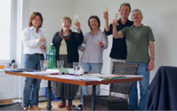
Einblicke in Kontaktstellen v.l.n.r.: drei Mal Bern...