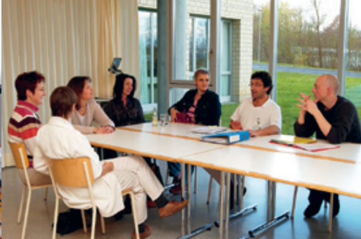
Einblicke in Kontaktstellen. v.l.n.r.: Lausanne, Solothurn, Luzern

Zwei Stellen haben diesen Schritt nicht geschafft und wurden aufgelöst.