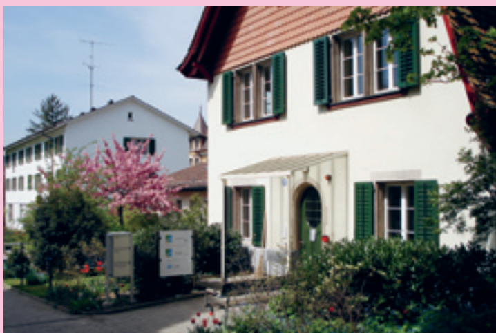
Selbsthilfezentrum Offene Tür Zürich