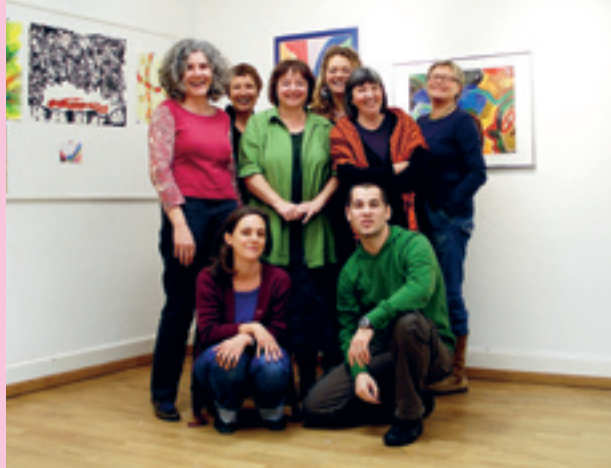
Das Team Zentrum Selbsthilfe Basel

Methodische Grundlagen: Da das Arbeitsgebiet von Selbsthilfekontaktstellen doch noch relativ neu und noch wenig in Lehrgängen verankert ist, haben der Wissenstransfer zwischen den einzelnen Stellen und Impulse aus anderen Ländern eine grosse Bedeutung. Diese Aufgaben werden von der IG Selbsthilfekontaktstellen wie auch durch die Geschäftsstelle KOSCH übernommen. Für die Selbsthilfegruppen konnte mit dem Beobachter-Ratgeber «Selbsthilfe in Gruppen», der nächstes Jahr auch in einer französischen Version erscheinen wird, eine Grundlage geschaffen werden. Sie entlastet die Selbsthilfekontaktstellen davon, eigene Merkblätter und Richtlinien zu erarbeiten.