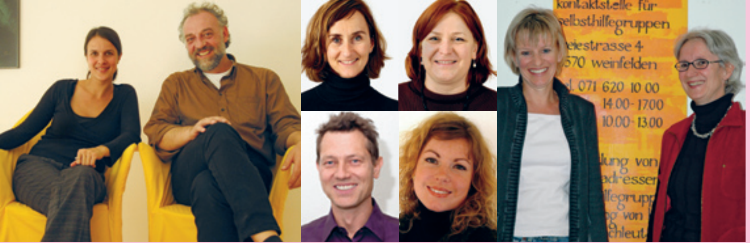
Einblicke in Kontaktstellen; v.l.n.r.: Team Winterthur, Graubünden, Team Zürcher Oberland, Team Thurgau